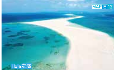
MAP E 12