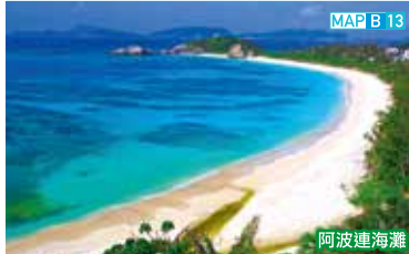
MAP B 13