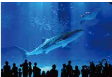
海洋博公園·沖繩美麗海水族館